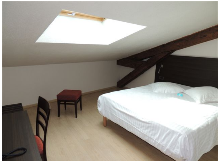
Chambre confort mansardée