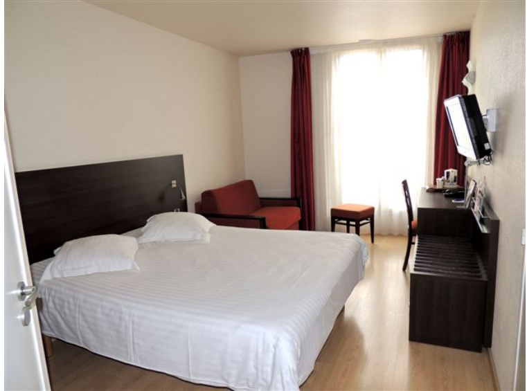
Chambre supérieure double