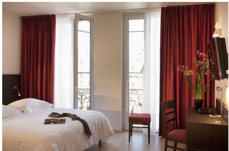
Chambre deluxe double